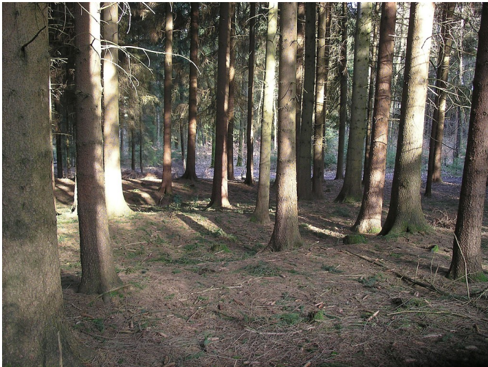
Hohlwegbündel bei Gassenhagen (2007)