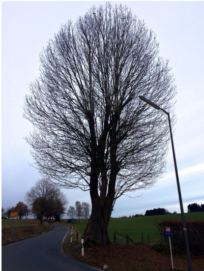
Die Kopfesche an der K44 in Marienheide-Wilbringhausen (2016)