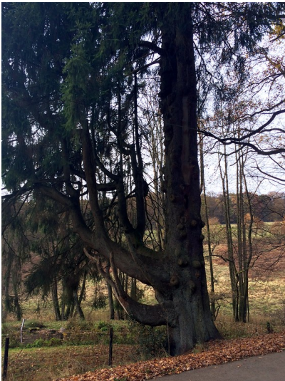
Naturdenkmal "Zigeunerfichte" am Gimborner Dreieck (2016)