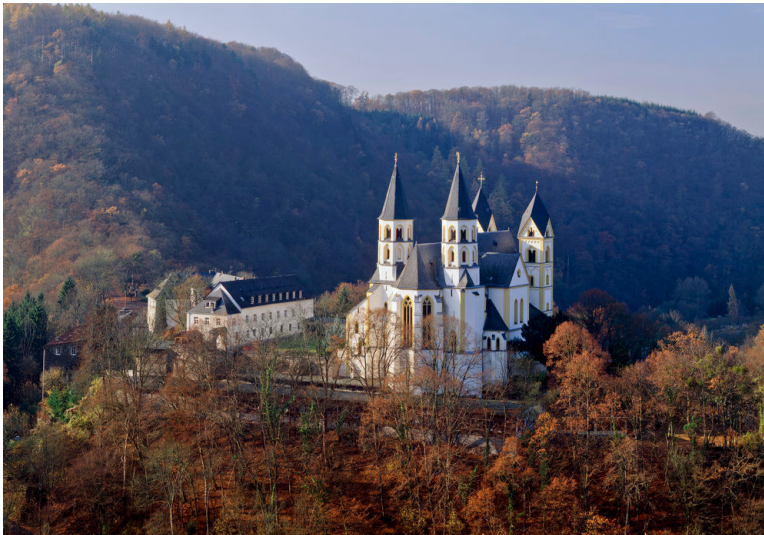
Blick auf das Kloster Arnstein im Lahntal (2005)