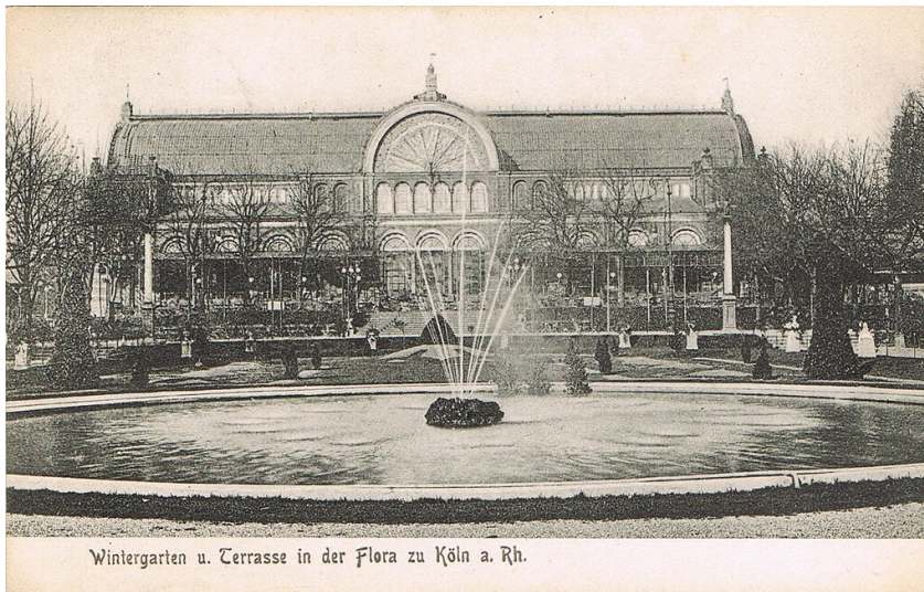
Undatierte historische Postkarte: "Wintergarten u. Terrasse in der Flora zu Köln a. Rh."