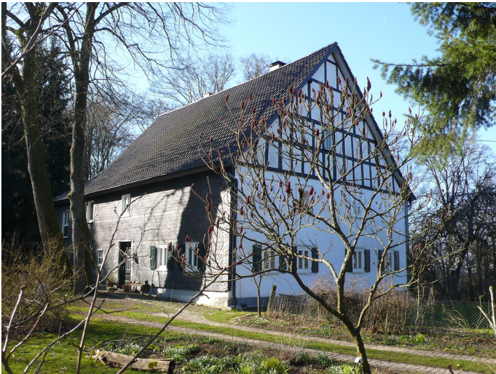
Forsthaus Mohrenbach