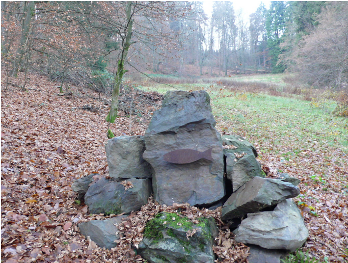
Ruheforst Wildenburger Land