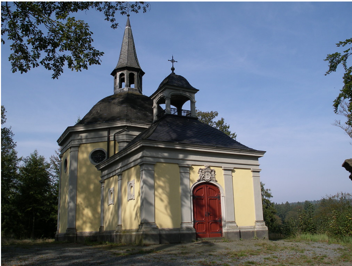
Heilig-Kreuz-Kapelle bei Schloss Crottorf