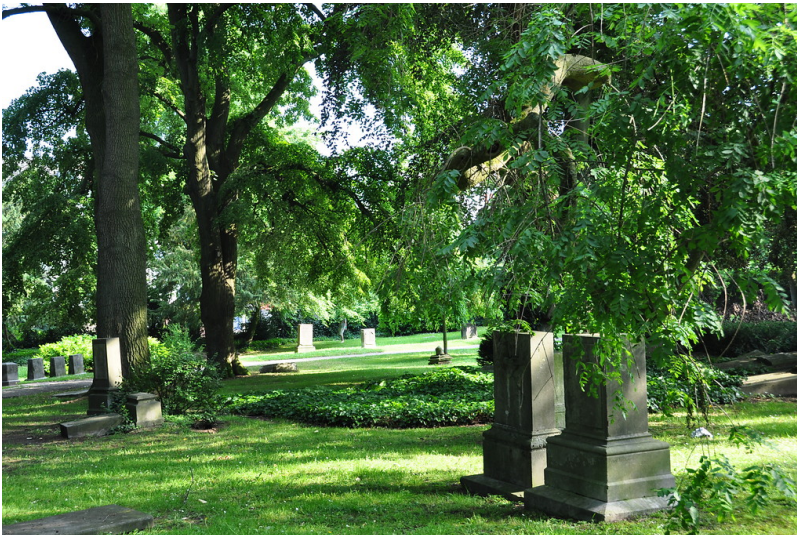
Ehemaliger Friedhof Guldtenplan (2014)