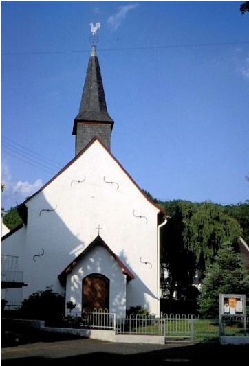
Evangelische Antoniuskapelle in Anzhausen (2005)