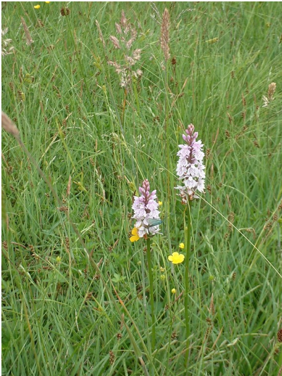
Orchideen auf den Gernsdorfer Wiesen (2002).