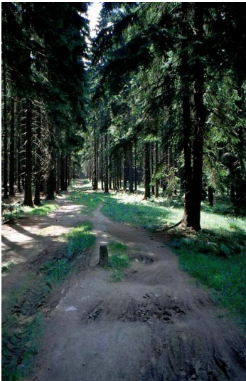
Grenzstein zwischen Nassau und Hessen auf der Haincher Höhe (2005)