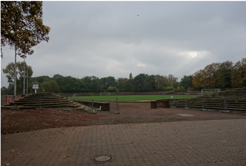
Rheinpreußenstadion in Moers-Meerbeck (2016)