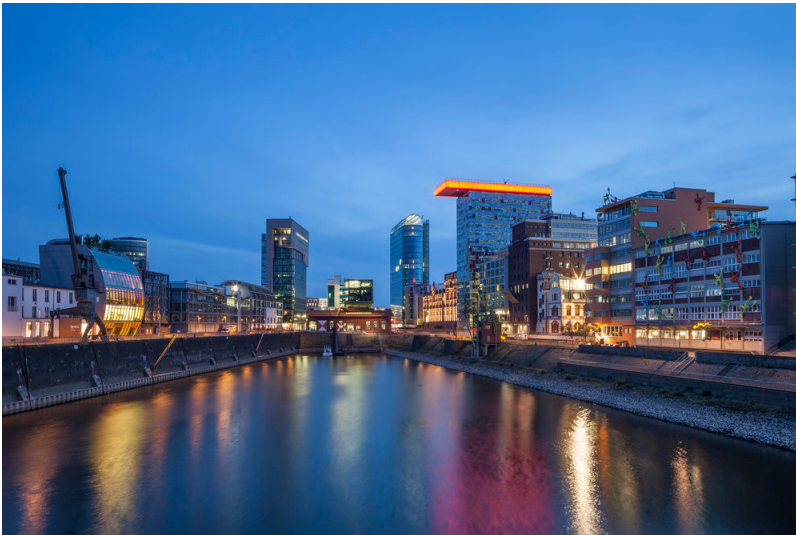
Medienhafen Düsseldorf (2011)