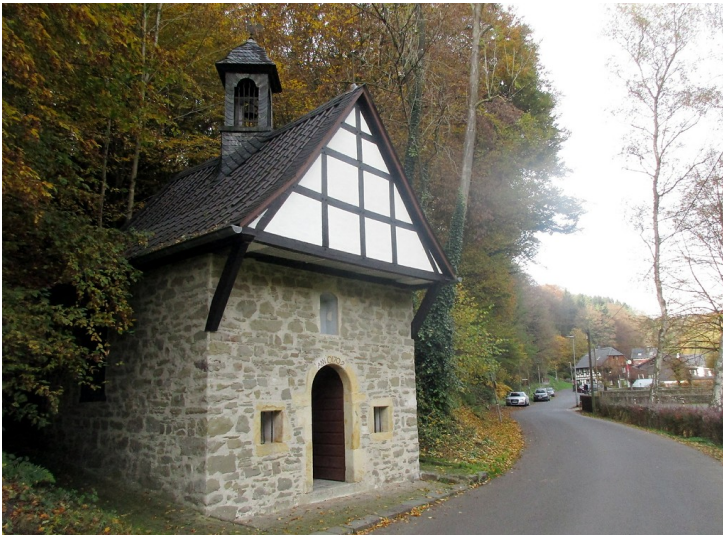
Die 1709 erbaute Rochuskapelle Seligenthal (2016).