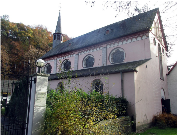
Die 1247-1256 erbaute Klosterkirche Seligenthal bei Siegburg (2016).