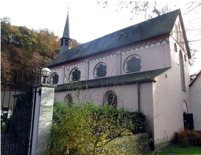
Die 1247-1256 erbaute Klosterkirche Seligenthal bei Siegburg (2016).