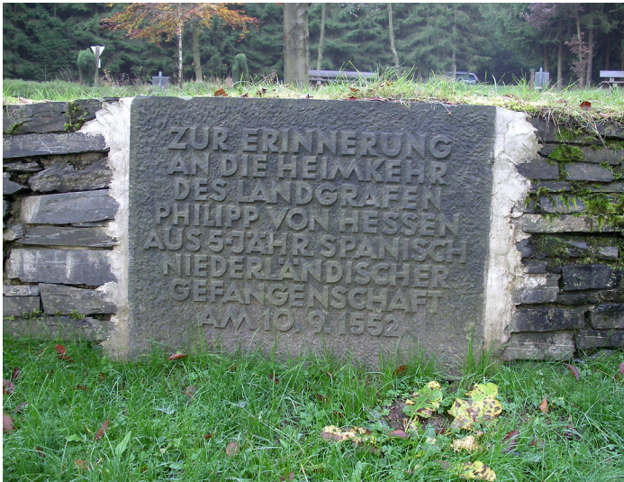
Erinnerungstafel vor der Phillipsbuche bei Simmersbach (2004)