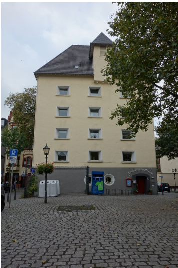
Hochbunker am Neumarkt in Duisburg-Ruhrort (2016)