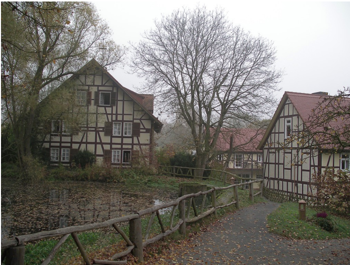
Mühlengebäude der historischen Dammühle bei Wehrshausen (2004)