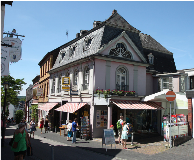
Wohn- und Geschäftshaus in der Mühlenbachstraße 40 in Sinzig (2015).