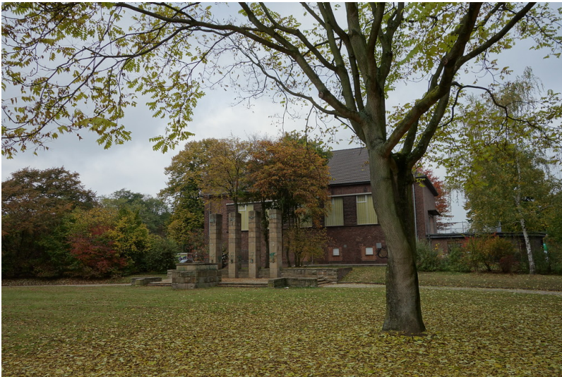
Parkanlage mit Kriegerdenkmal an der Bismarckstrasse in Moers-Meerbeck (2016)