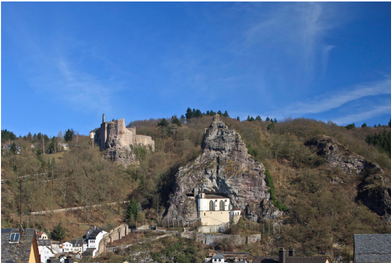
Felsenkirche und Ruine von Burg Oberstein in Idar-Oberstein (2009)