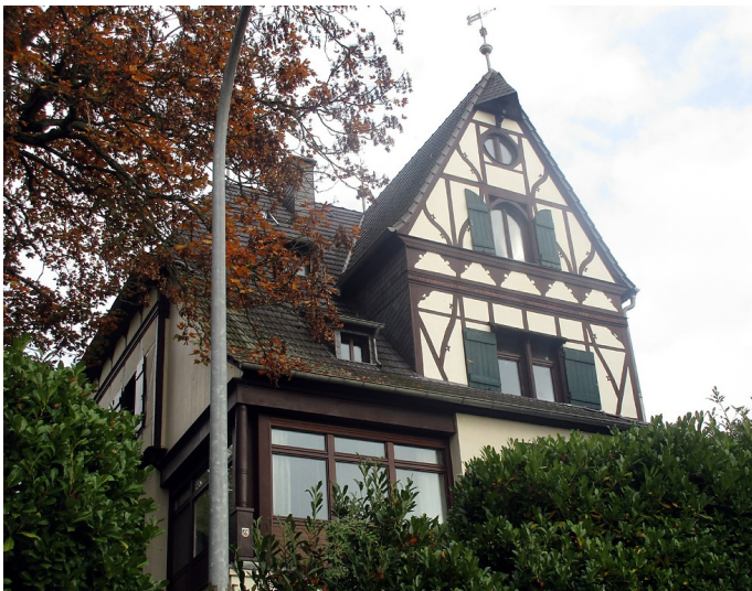
Das "Landhaus Feuser", Frankenweg 52 (früher Am Sperrbaum Nr. 5) in Bad Honnef-Rhöndorf (2016).