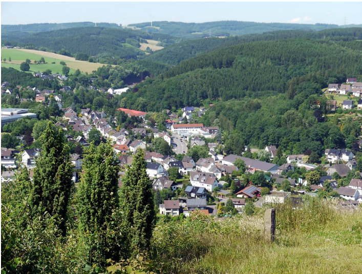
Wacholderbestand auf der Hohen Hardt bei Morsbach (2016)