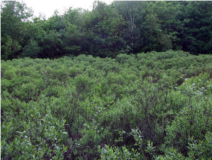
Gagelbestand im NSG Fronnenbroich-Buschhorner Bruch (2013)