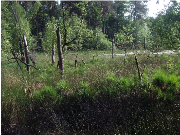
NSG Niedermoor im Widdauer Wald (2015)