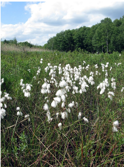
Wollgras im Further Moor (2009)