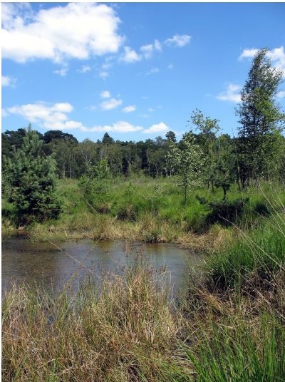
Ein Heideweiher in der Ohligser Heide (2008)