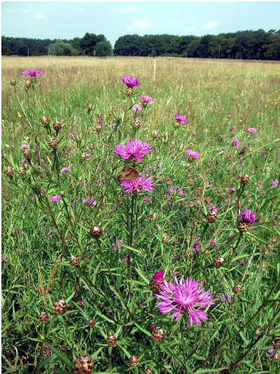
Die Mielenforster Wiese im Iddelsfelder Hardt (2013)