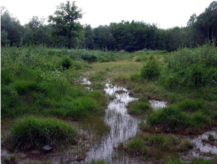
Ein Kalkquellsump im Thielenbruch (2013)