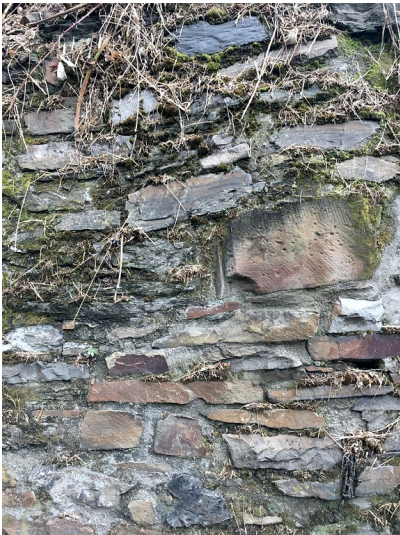
Fragmente vermutlich jüdischer Grabsteine in einer Stützmauer in der Allerheiligenbergstraße in Niederlahnstein (2016)