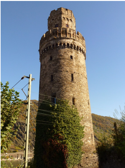
Ochsenturm der Stadtbefestigung Oberwesel (2016)