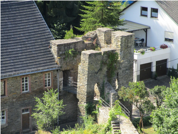
Mühlentorturm der Stadtbefestigung in Oberwesel (2016)