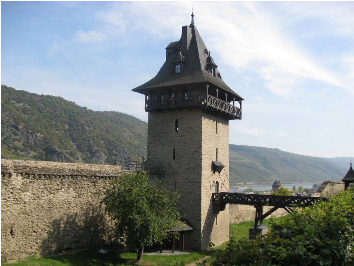
Kuhhirtenturm in Oberwesel (2016): Im sechsten Stock ist ein zur Stadt hin vorkragender Erker mit Fenstern zu allen Seiten auszumachen.