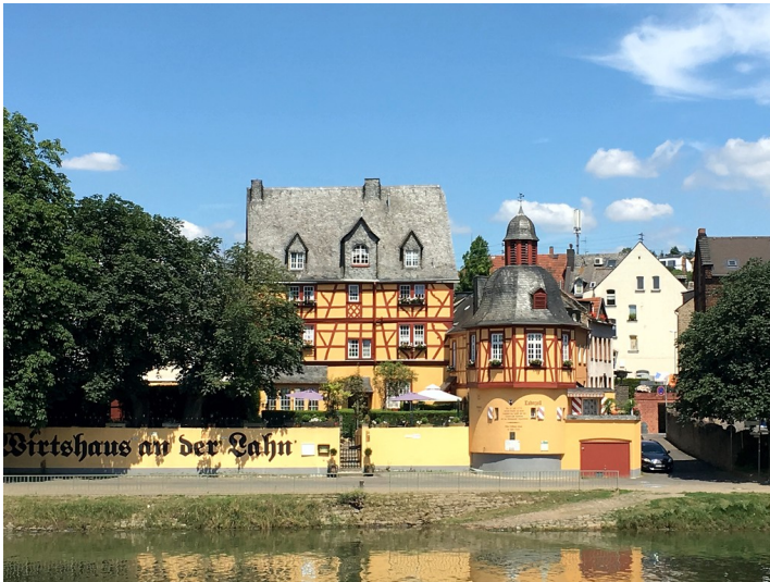
Wirtshaus an der Lahn in Niederlahnstein (2016)