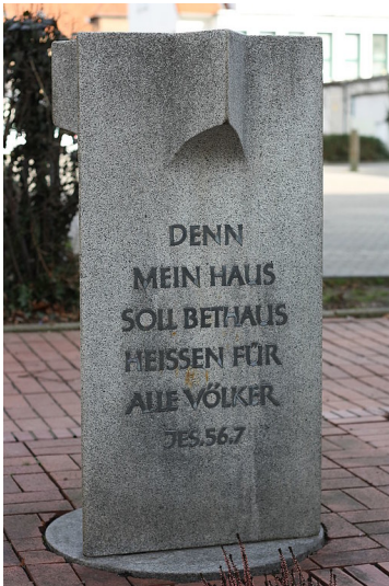
Der 1984 errichtete Gedenkstein zur Erinnerung an die frühere Meckenheimer Synagoge in der heutigen Professor-Scheeben-Straße am Synagogengplatz (2011).