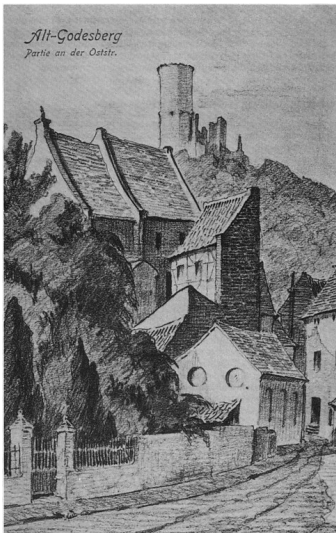
Bleistiftzeichnung von M. E. Peters (1905): "Alt-Godesberg, Partie an der Oststr.". Im Hintergrund die Godesburg, unten rechts im Bild die Synagoge in der vormaligen Synagogengasse (heutige Oststraße). Fotograf/Urheber: M. E. Peters