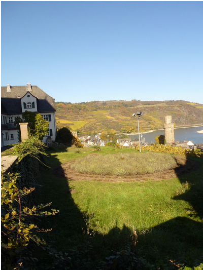
Pfarrgarten St. Martin Oberwesel (2016): Der Garten gehört zum katholischen Pfarrhaus von Oberwesel.