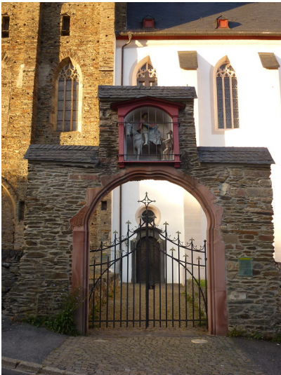
Das Martinstor in Oberwesel (2016).