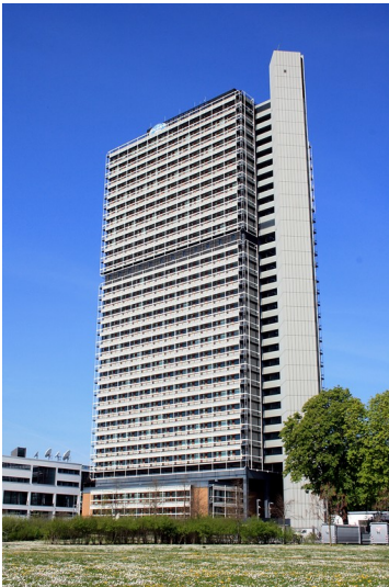
Der Lange Eugen im früheren Regierungsviertel der Bundesstadt Bonn (2015).