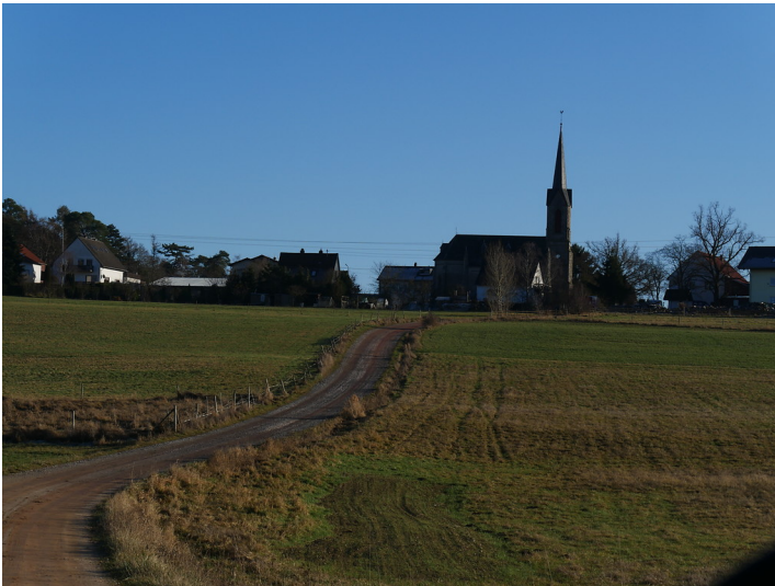
Oberer Abschnitt des Totenwegs von Seibersbach nach Dörrebach (2016).