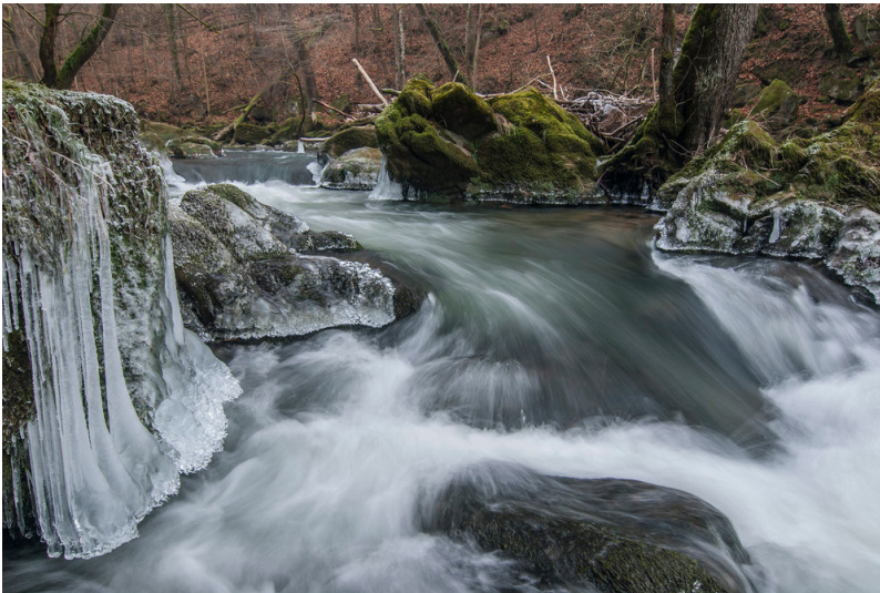
Stromschnelle der Prüm (2007)