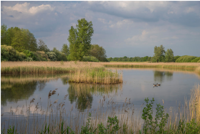
Biotop im Kranenburger Bruch (2015)