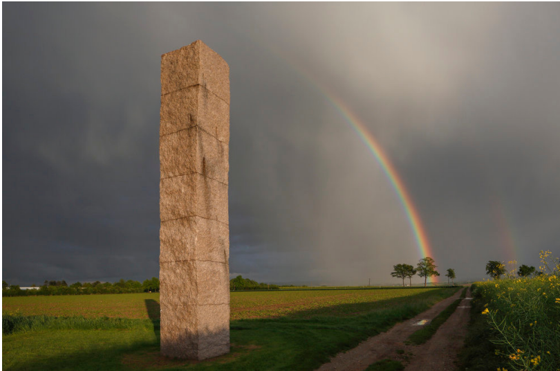
Rückriem-Skulptur in Zülpich (2014)