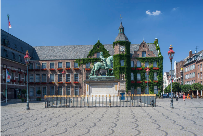
Jan-Wellem-Denkmal in Düsseldorf (2008)