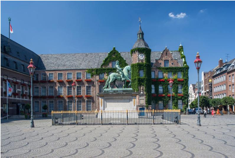
Jan-Wellem-Denkmal in Düsseldorf (2008)