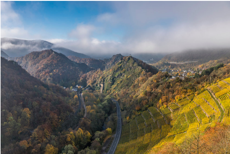
Blick über das Ahrtal mit Altenahr und Burg Are (2015)