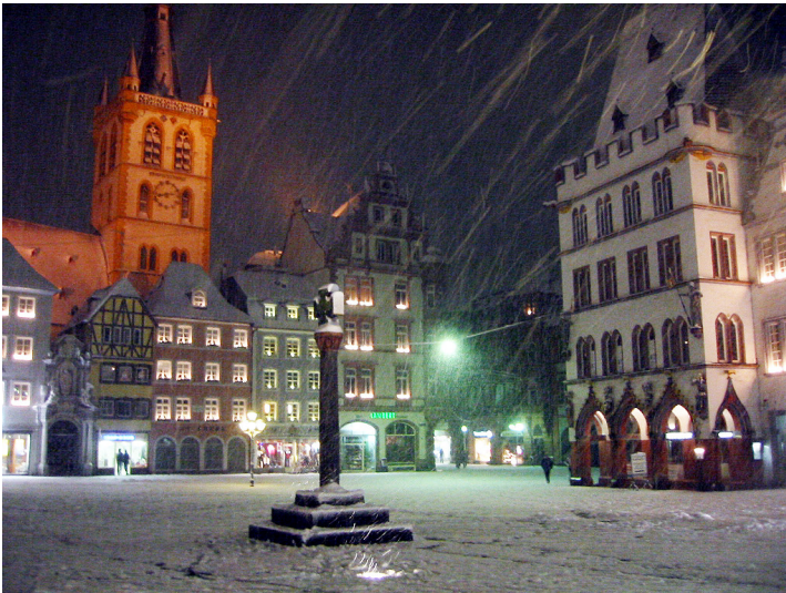
Der Trierer Hauptmarkt mit dem mittelalterlichen Marktkreuz (heute eine Kopie) im abendlichen Schneetreiben; links die Marktkirche St. Gangolf, rechts das gotische Gebäude 'Steipe' (2004)