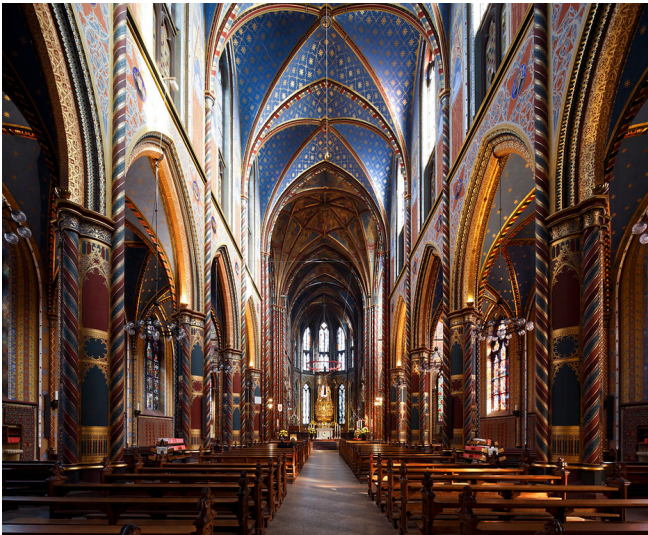
Sankt Marien-Basilika in Kevelaer, Innenaufnahme (2009)