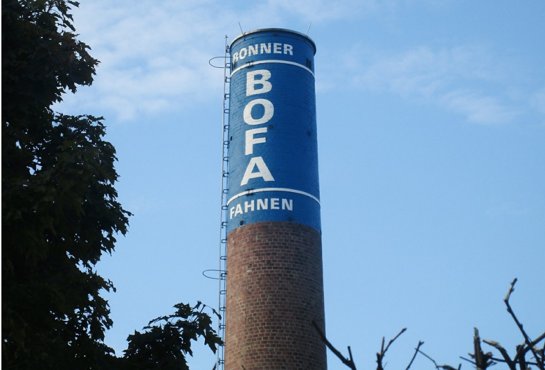
Fabrikschornstein der Fahnenfabrik BOFA in Bonn-Graurheindorf (2016).