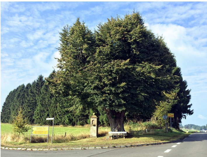
Naturdenkmal Dicke Linde in Marienheide (2016)